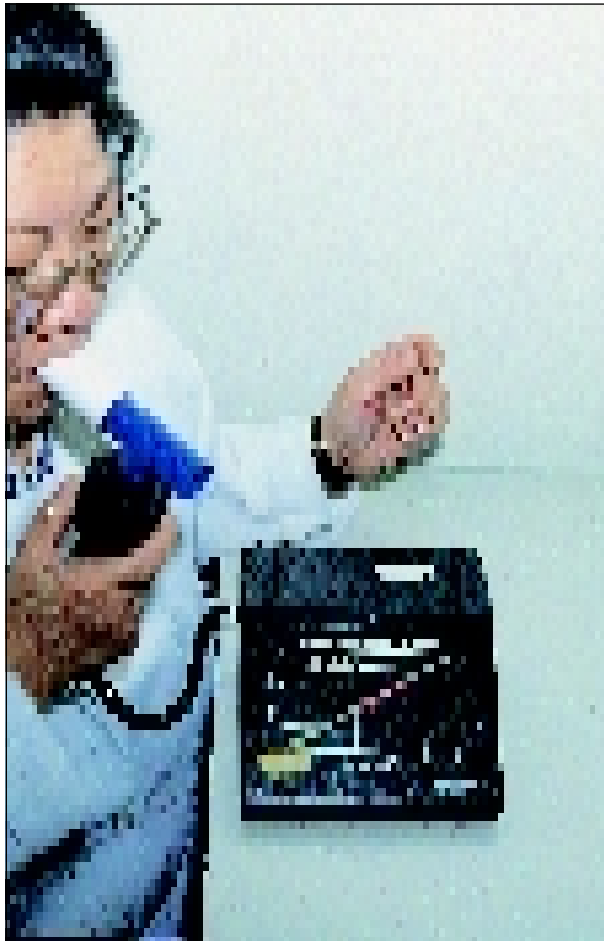
Fig 1 - Equipamento utilizado para determinar a concentração de monóxido de carbono do ar expirado ( mini-smokerlyser ).